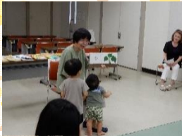
講演会の様子です