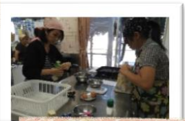
みんなで楽しくクッキング