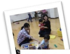
「おやつとの与え方」のお話

1時間ほどボランティアの方とお話ししながら親子で遊び、そのあとそっとお母さんは部屋を出て、調理室へ。大野城市食生活改善推進委員の方から、おやつとの与え方などのお話のあと、みんなでおやつ作りをしました。メニューはキャロットかん、カラフル白玉、かんたんボンテケーキです。和気あいあいと楽しく調理していました。最後はみんなで試食。お母さん子ども達も、そしてボランティアの方も楽しい時間を過ごすことができました。問い合わせ先：中公民館 TEL:092-504-0258