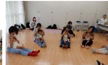
次回開催は、11月28日（木）です。