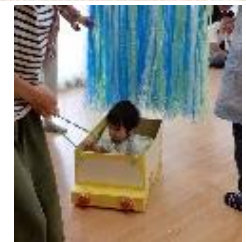
シャラシャカーテン通過！