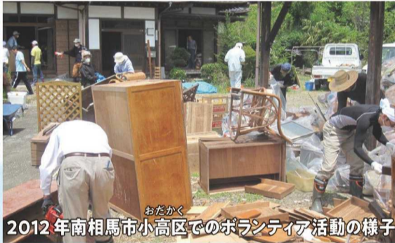
2012年南相馬市小高区でのボランティア活動の様子