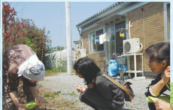
2013年南相馬市内仮設住宅の高齢者訪問に同行