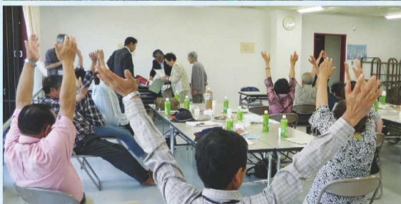
2013年南相馬市の高齢者サロンを視察研修