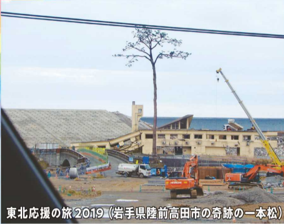
東北応援の旅2019 (岩手県陸前高田市の奇跡の一本松)