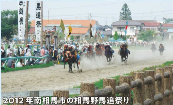
2012年南相馬市の相馬野馬追祭り