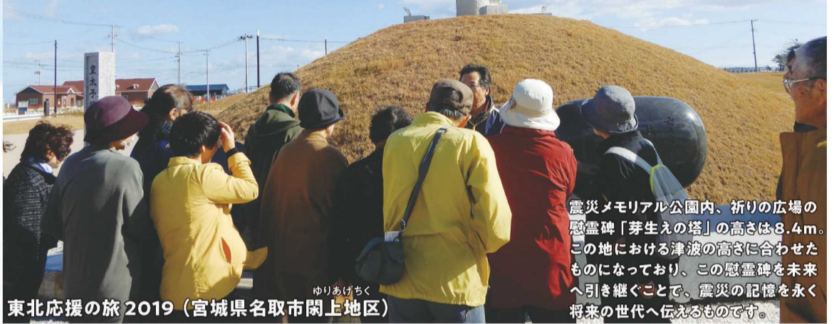
東北応援の旅2019 (宮城県名取市閑上地区)

震災メモリアル公園内、祈りの広場の慰霊碑「芽生えの塔」の高さは8.4m。この地における津波の高さに合わせたものになっており、この慰霊碑を未来へ引き継ぐことで、震災の記憶を永く将来の世代へ伝えるものです。