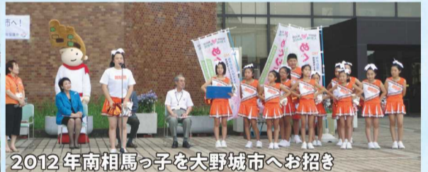
2012年南相馬っ子を大野城市へお招き