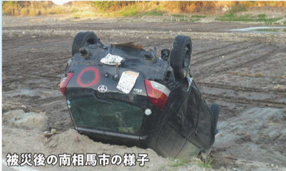
被災後の南相馬市の様子

震災メモリアル公園内、祈りの広場の慰霊碑「芽生えの塔」の高さは8.4m。この地における津波の高さに合わせたものになっており、この慰霊碑を未来へ引き継ぐことで、震災の記憶を永く将来の世代へ伝えるものです。