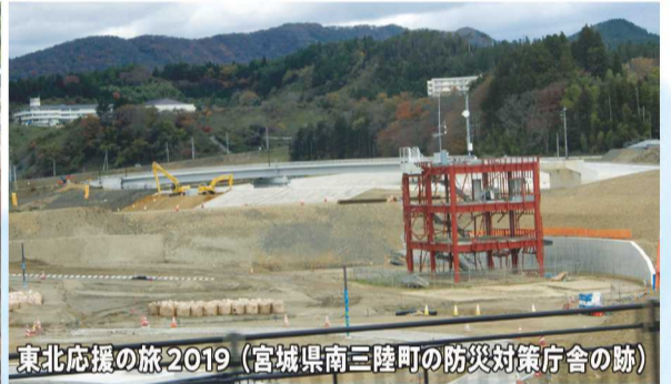
東北応援の旅2019 (宮城県南三陸町の防災対策庁舎の跡)