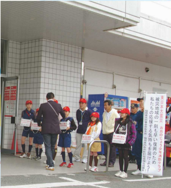
2011年4月おおのじょう少年消防クラブ街頭募金