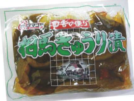
↑相馬きゅうり漬(315g) 370円

大野城市社会福祉協議会では、東日本大震災の被災地支援の一環として、福島県の特産品や、被災地応援グッズの販売を行っています。今後も継続して支援を行い、大野城市から元気を発信していきたいと思っています。ご支援よろしくお願いたします!