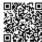
お申し込み フォーム

予約方法 2022年2月7日(月)から受付開始 ※先着順 2月18日(金)までに下記の参加申込書の提出、 もしくは右のお申し込みフォームからのお申し込みを もって予約完了です。 参加申込書はFAX・郵送・窓口持参 (平日8:30~17:00)にてご提出ください。