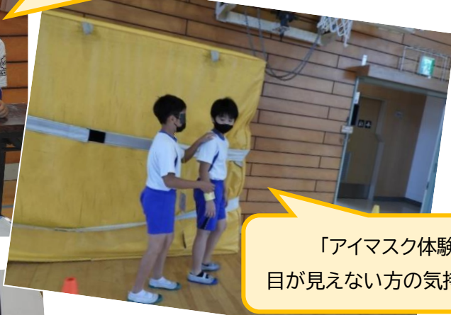
「アイマスク体験」 目が見えない方の気持ちは？