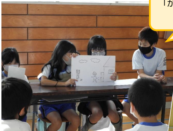
「かみしばい」でバリアフリーについて わかりやすくご紹介♪