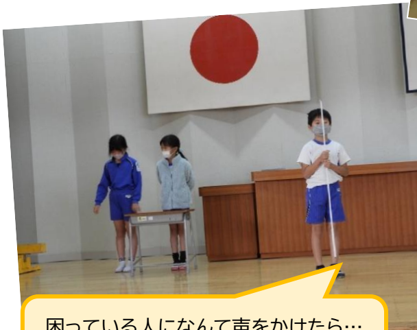
困っている人になんて声をかけたら… 劇でわかりやすくお伝えします！