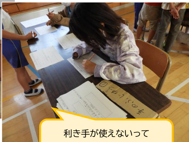
利き手が使えないって どんな感じ？