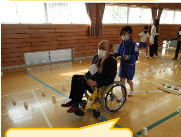
車いすの方にとって 通りやすい道って？