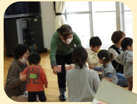
跳びはねるウサギを 作りました♪