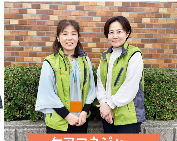
ケアマネジャー (指定居宅介護支援事業)

ケアプラン作成やホームヘルパーなど、在宅での生活を支える介護サービスを行っています。お気軽にご相談ください。