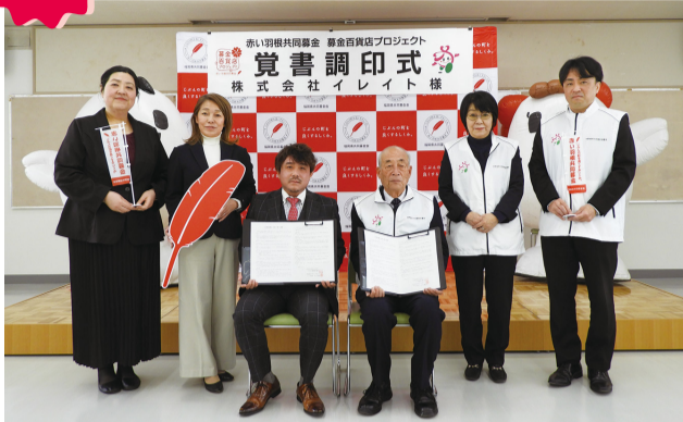
覚書調印式の様子 (令和8年3月9日)

イレイト工房のお菓子は国産小麦粉・きび砂糖・北海道産バターを主原料にし「おいしい」だけでなく「安心」「安全」をコンセプトに丁寧に作っています。(工房ホームページより抜粋)