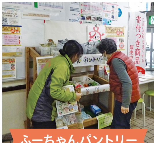
ふーちゃんパントリー

企業や市民の方から寄附いただいた食料を、生活にお困りの方へお渡ししています。 ※開催は不定期です。開催時にはホームページや公式LINEでお知らせしています。