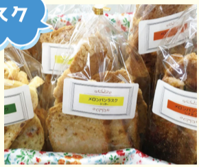
大野城市障がい者支援センター「まどか・ゆいばる」