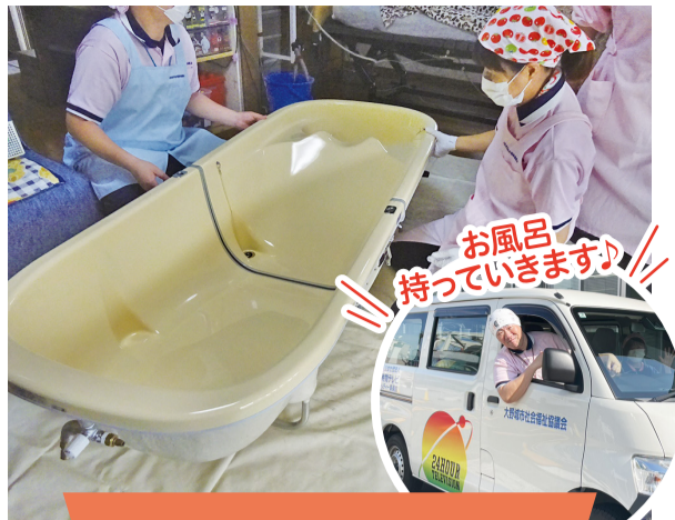
訪問入浴介護事業