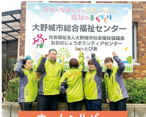
ホームヘルパー (訪問介護事業)