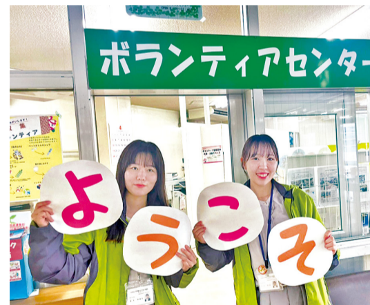
ボランティアセンター運営

企業や市民の方から寄附いただいた食料を、生活にお困りの方へお渡ししています。 ※開催は不定期です。開催時にはホームページや公式LINEでお知らせしています。