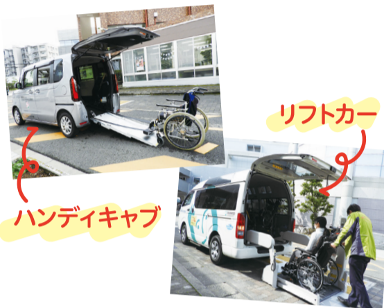
ハンディキャブ貸出 リフトカー運行

ケアプラン作成やホームヘルパーなど、在宅での生活を支える介護サービスを行っています。お気軽にご相談ください。